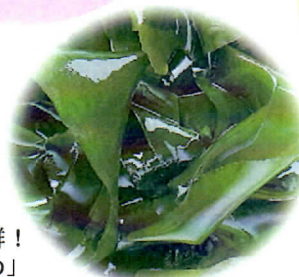
ミネラル抜群! 「鳴門わかめ」