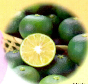
徳島の味! さっぱり♪ 「すだち」