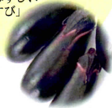
みずみずしい 「なすび」