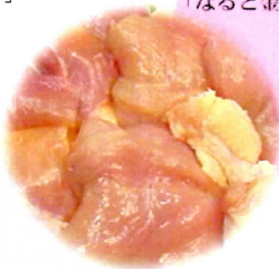
地鶏 JAS第1号 「阿波尾鶏」