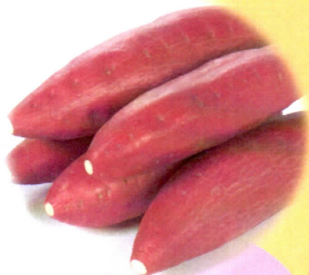
徳島を代表するトップブランド 「なると金時」