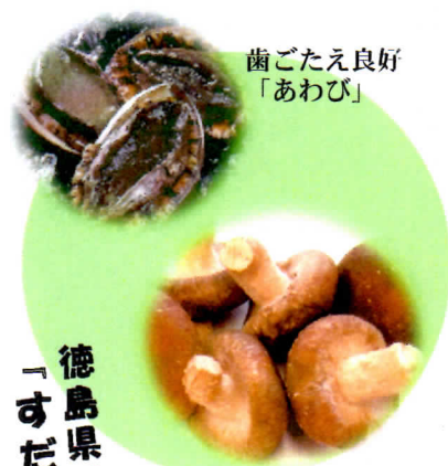
歯ごたえ良好 「あわび」