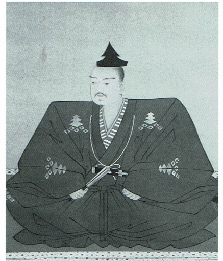
三好元長 画像(坂東広隆氏所蔵)

いわゆる「堺幕府」の中心人物として、室町幕府12代将軍の足利義晴を近江に追い落とし、管領の細川高国を破るなど畿内で活躍した戦国武将。堺幕府は最終的に内部抗争によって瓦解し、元長は顕本寺において非業の死を遂げた。享年32歳。元長の功績は、後に長男の三好長慶、次男の三好実休、三男の安宅冬康、四男の十河一存ら息子達に引き継がれ、室町幕府打倒の原動力となっていく。