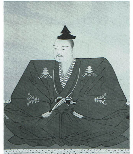
三好元長 画像

いわゆる「堺幕府」の中心人物として、室町幕府12代将軍の足利義晴を近江に追い落とし、管領の細川高国を破るなど畿内で活躍した戦国武将。堺幕府は最終的に内部抗争によって瓦解し、元長は顕本寺において非業の死を遂げた。享年32歳。元長の功績は、後に長男の三好長慶、次男の三好実休、三男の安宅冬康、四男の十河一存ら息子達に引き継がれ、室町幕府打倒の原動力となっていく。