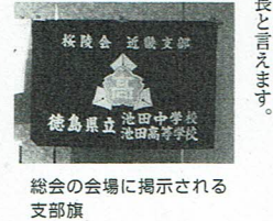
総会の会場に掲示される支部旗

歴史に残るであろう未曾有の惨事「コロナ禍」。社会の在り方が激変し、これまでの常識や経験値は全く通用しなくなってしまう。桜陵会近畿支部も大きな課題に直面していることは確かです。 「活動も出来なく財政的に苦しいのであれば、この際解散したら。残預金は母校に寄付して。」「年会費制はやめて総会開催だけに」というご意見が寄せられています。ここ数年、会員減(高齢化)、年会費減により支部財政が悪化している状況を見ると、こうした意見は止むを得ないことと思います。 しかし、私達には生来、家族愛、ふるさと愛、母校愛、職場愛、近隣愛、宗教愛など、意識するしないにかかわらず心のよりどころとなる「愛」といふものを